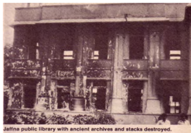
Jaffna public library with ancient archives and stacks destroyed.