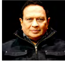
பி. ஏ. காதர்

அமெரிக்காவின் பெற்றோலிய ஏகபோகம் மத்திய கிழக்கில் இருந்த பிரித்தானியாவின் செல்வாக்கு பிரதேசங்களில் பெற்றோலியம் கண்டு பிடிக்கப்பட்ட பின்னரே இல்லாமற் போனது. (Masjid Suleiman - 1) என்ற முதலாவது எண்ணெய்க்கிணறு மத்திய கிழக்கில் - ஈரானில் - தனது பெற்றோலிய விற்பனையை 1908 மே மாதம் 26ந் திகதி தொடங்கியது. அதன் பின்னர் ஈரானின் எண்ணெய் உற்பத்தி நீண்டகாலம் பிரித்தானியரது கட்டுப்பாட்டிலிருந்தது. பெற்றோலிய பொருட்களை ஏற்றுமதி செய்வதற்கும் விற்பனை செய்வதற்கும் ஈரானுக்கு உரிமையிருக்கவில்லை. விற்பனை செய்யப்படும் ஒவ்வொரு டொன்னுக்கும் மிகவும் சிறிய அளவு தொகை ஈராக்கிற்கு வழங்கப்பட்டது.