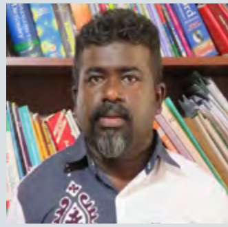
இலங்கை வார இதழ்க்கு வழங்கிய விசேட செவ்வியலேயை அவர் இதனை நெறிநிந்தார். இதன்போது அவர் வழங்கிய பேட்டியின் விபரம்.

வடக்கு கிழக்கில் தமிழ் தேசியம் பேசுகின்ற அல்லது நாங்கள் பெரிய தமிழ் தேசியவாதிகள்