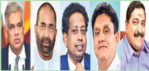
பெருந்தோட்ட மக்களை தேர்தல் காலங்களில் இரத்தத்தின் இரத்தங்களாக கருதும்

ஆட்சியாளர்களின் சில முன்னெடுப்புக்களை நோக்கும்போது 'இலங்கையர்' என்ற பொதுவரையறைக்குள் உள்ளீர்க்கப்படாது காரிய மாற்றப்படுவதனை எம்மால் அவதானிக்கக் கூடியதாக உள்ளது.